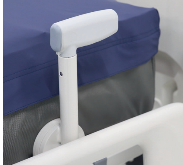
Einfacher aufstehen dank MobiLift®-Griff

Lösung für Pflegeheime verleiht dem Bett ein wohnliches Aussehen, kann auf verschiedene Höhen eingestellt werden und unterstützt die PatientInnen beim Aufstehen. Geteilte Safe&Free-Seitensicherungen unterstützen in Kombination mit Mobilisierungsfunktionen beim Ein- und Ausstieg aus dem Bett und helfen bei der frühzeitigen Mobilisierung. Klappbare Elemente tragen schliesslich wirksam zur Sturzprävention bei und sind dank des einfachen Auslösemechanismus' vom Personal leicht zu bedienen.