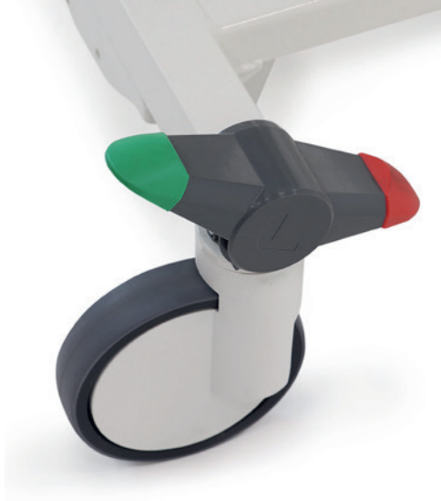
Soft Brake sorgt für mehr Sicherheit.