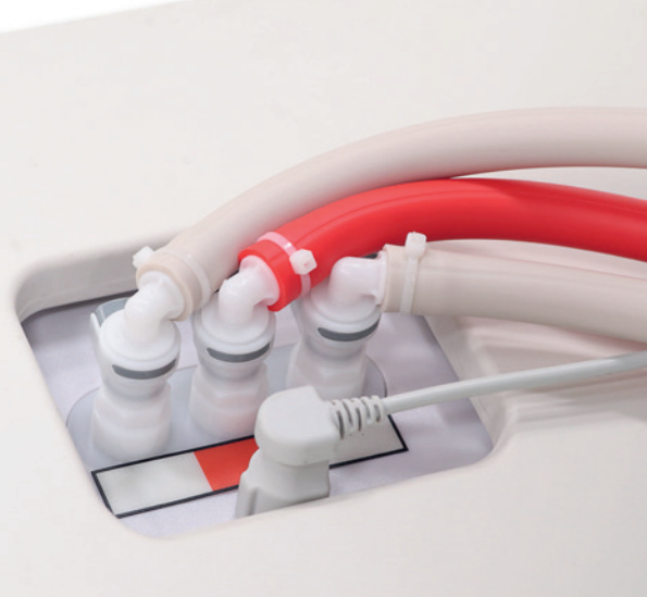
Eingebauter lautloser Kompressor