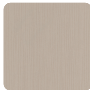
wissner-bosserhoff | movita sc