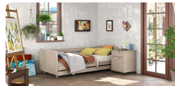
Wohnidee Mediterran | Design Df