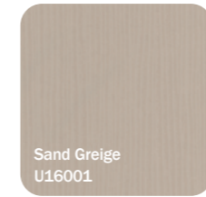
Sand Greige U16001