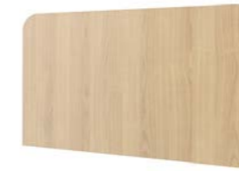
Design Df Kopf-/Fußteil

Wir empfehlen ein Originalmuster für die endgültige Farbauswahl zu verwenden, da die Farben von den gedruckten Abbildungen abweichen können.