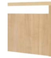
Design Ts Fußteil