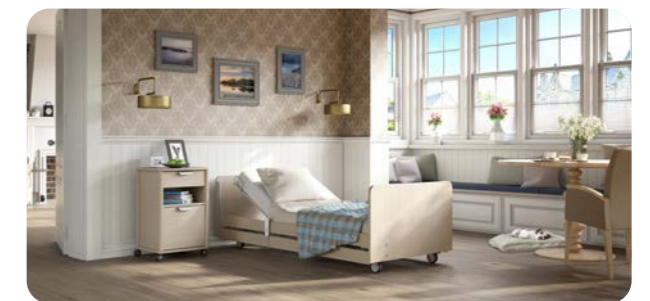
Wohnidee Cornwall | Design Df