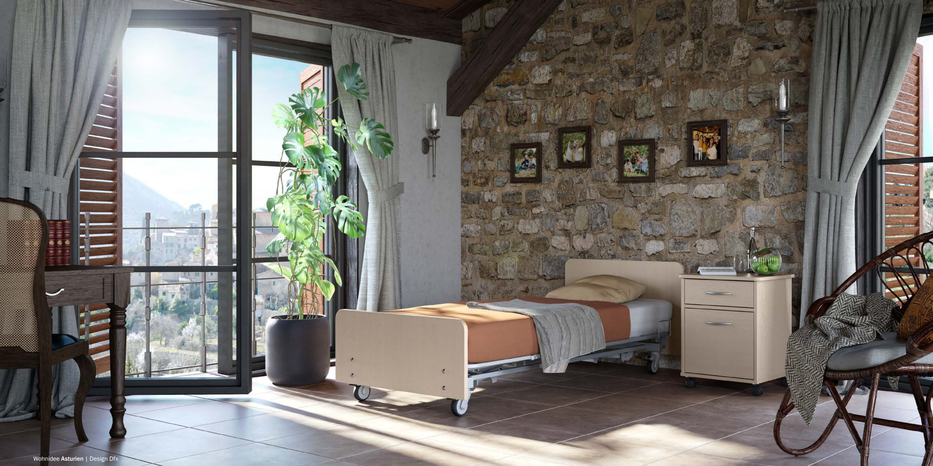
Wohnidee Asturien | Design Dfx