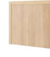
Design Ts Kopfteil