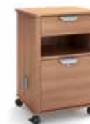
Nachtisch vitalia 2