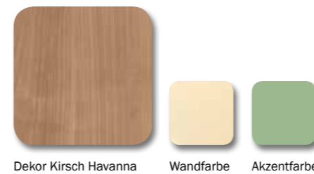
Dekor Kirsch Havanna Wandfarbe Akzentfarbe

Material- und Farbauswahl greifen den aktuellen, natürlichen Wohntrend auf. So entsteht eine wohnliche, warme Atmosphäre, in der sich Bewohner aufgehoben und geborgen fühlen. Immer mehr Pflegeheime reagieren mit eigenständigen Wohnbereichen auf die zunehmende Zahl adipöser Bewohner. wissner-bosserhoff verbindet mit dem carisma 300 | 300-xxl das gewohnte Design mit der hohen Funktionalität zur Versorgung dieser Bewohner.