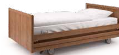
carisma 300-xxl, Design G09 3-fach