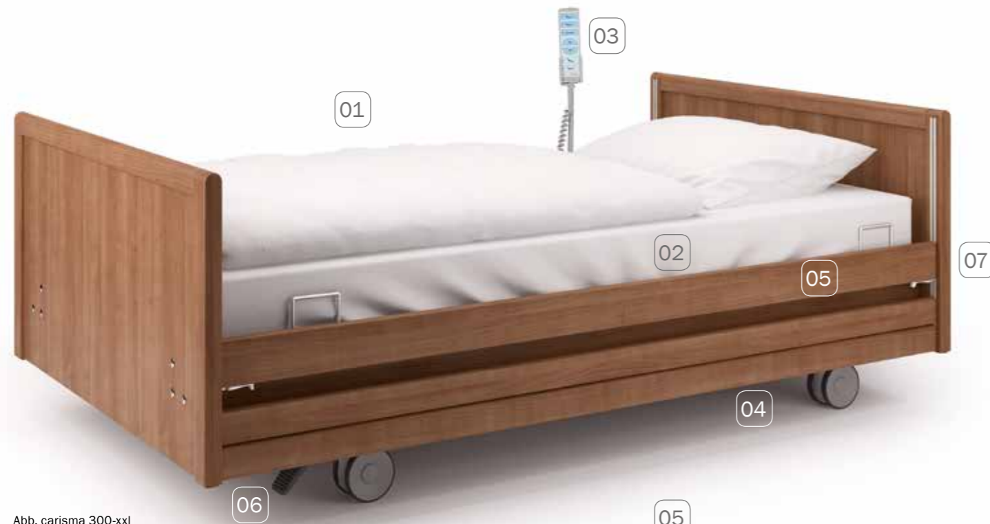
Abb. carisma 300-xxl