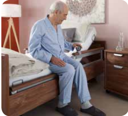
Aufsteh- und Mobilisationshilfe