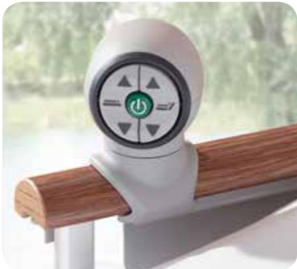
Controller ohne Kabel oder Batterie