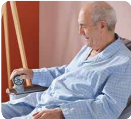
Individuell für jeden Bewohner einstellbar