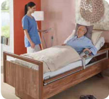
Einfache Bettbedienung für den Bewohner

SafeLift bietet einfachste Bedienung, sodass der Bewohner sein Bett selbstständig verstellen und in die für ihn optimale Mobilisationsposition bringen kann. Gleichzeitig kann er sich beim Aufstehen auf dem SafeLift-Controller abstützen. Dies fördert die Selbstmobilisation des Bewohners, reduziert Personalrufe zur Bettverstellung und entlastet die Pflege.