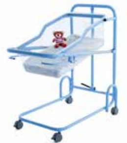
Seiten 6 - 7