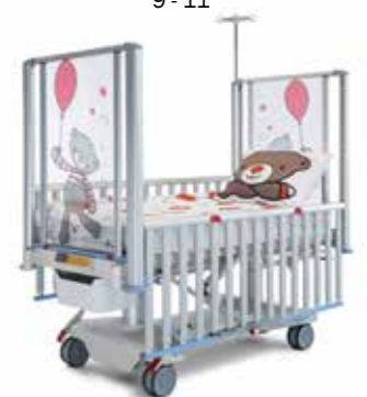
Seiten 9 - 11