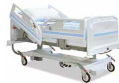
Seiten 12 - 13