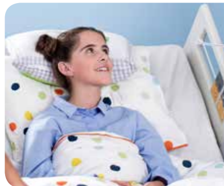
eleganza 2 junior kit

Kinder ab 4 Jahre Körpergröße: mindestens 90 cm