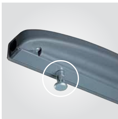
Verrouillage de la tablette