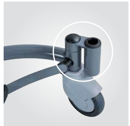
Support pour TPS