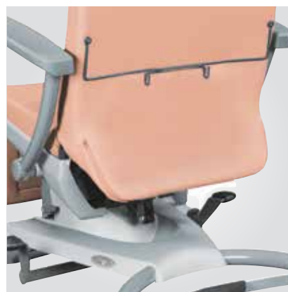
Porte poche à urine