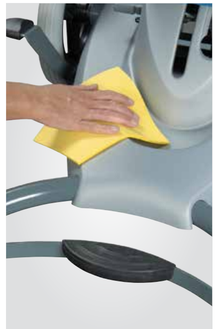
Nettoyage facile et rapide avec des produits désinfectants habituels.