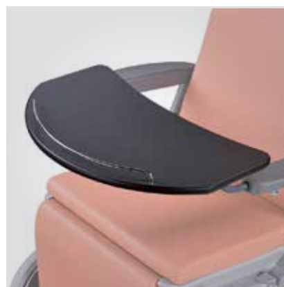
Tablette avec galerie anti-chute