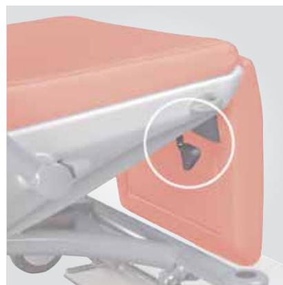
Mouvement du repose jambes indépendant