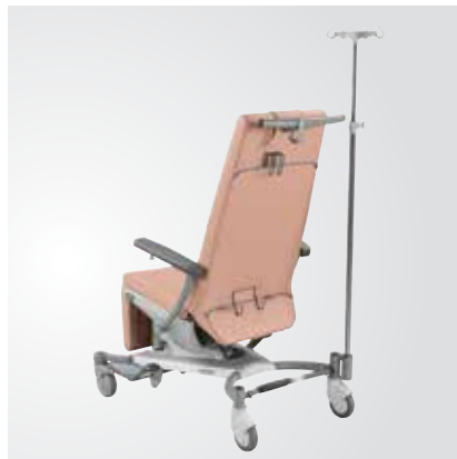
Tige à perfusion télescopique