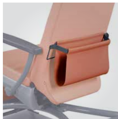
Pochette de rangement